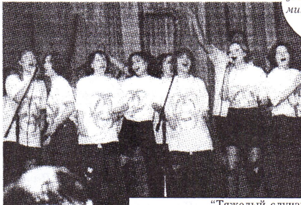
"Тяжёлый случай" - ЗапЕвают девчата-экологи

В Приморье потерпел крушение очередной нефтяной танкер. Green Peace уже бьёт тревогу. Так не дадим же морским котикам умереть от экологических проблем. Забьём их лопатами!