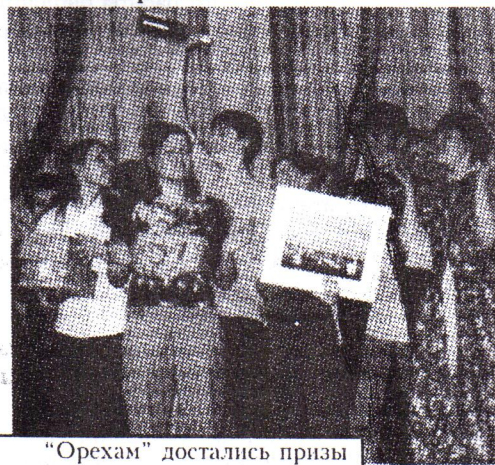
"Орехам" достались призы

Неожиданность, радость! Честно, очень неожиданно!