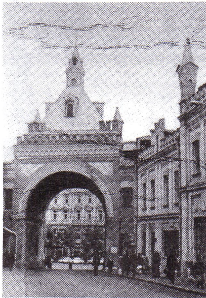
Москва. Третьяковский пр., VIII -76 г.

Мы решили обратиться за помощью и советом в редакцию газеты "Менделеевец", поскольку уничтожать фотографии было действительно жалко. В редакции к нам отнеслись с пониманием и благодарно решили принять этот "дар" в свои фонды (за что им ог-