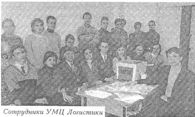
Сотрудники УМЦ Логистики

- "Логистик" владеет методами планирования и координации совместной деятельности различных предприятий,