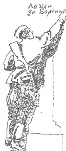
Рисунок Б. Житова