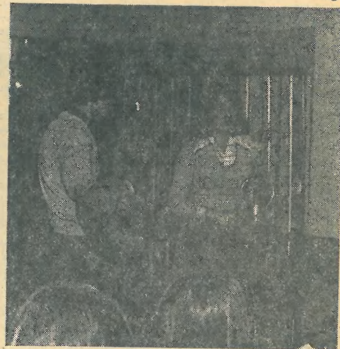
В кафе «Гель» выступает КСП.

Наверно, все студенты нашего института знают о существовании студенческого кафе «Гель», хотя и не все из них побывали на вечерах, проводившихся в этом кафе. Всем также известно, что эти вечера проводятся в помещении нашей столовой.