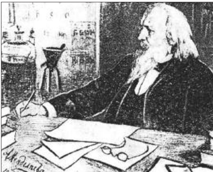
Рисунок Анны Менделеевой - жены Д.И. Менделеева