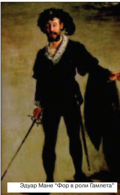
18 декабря 2008 в зале им. Бородинина прошла премьера спектакля по трагедии Шекспира "Гамлет, принц Датский". Это второй спектакль, который выпустила наша театральная студия за год с небольшим своего существования.

Путь к созданию спектакля был нелегким, однако время и усилия, которые были на него потрачены, не прошли даром. Актерам удалось донести до зрителей свои