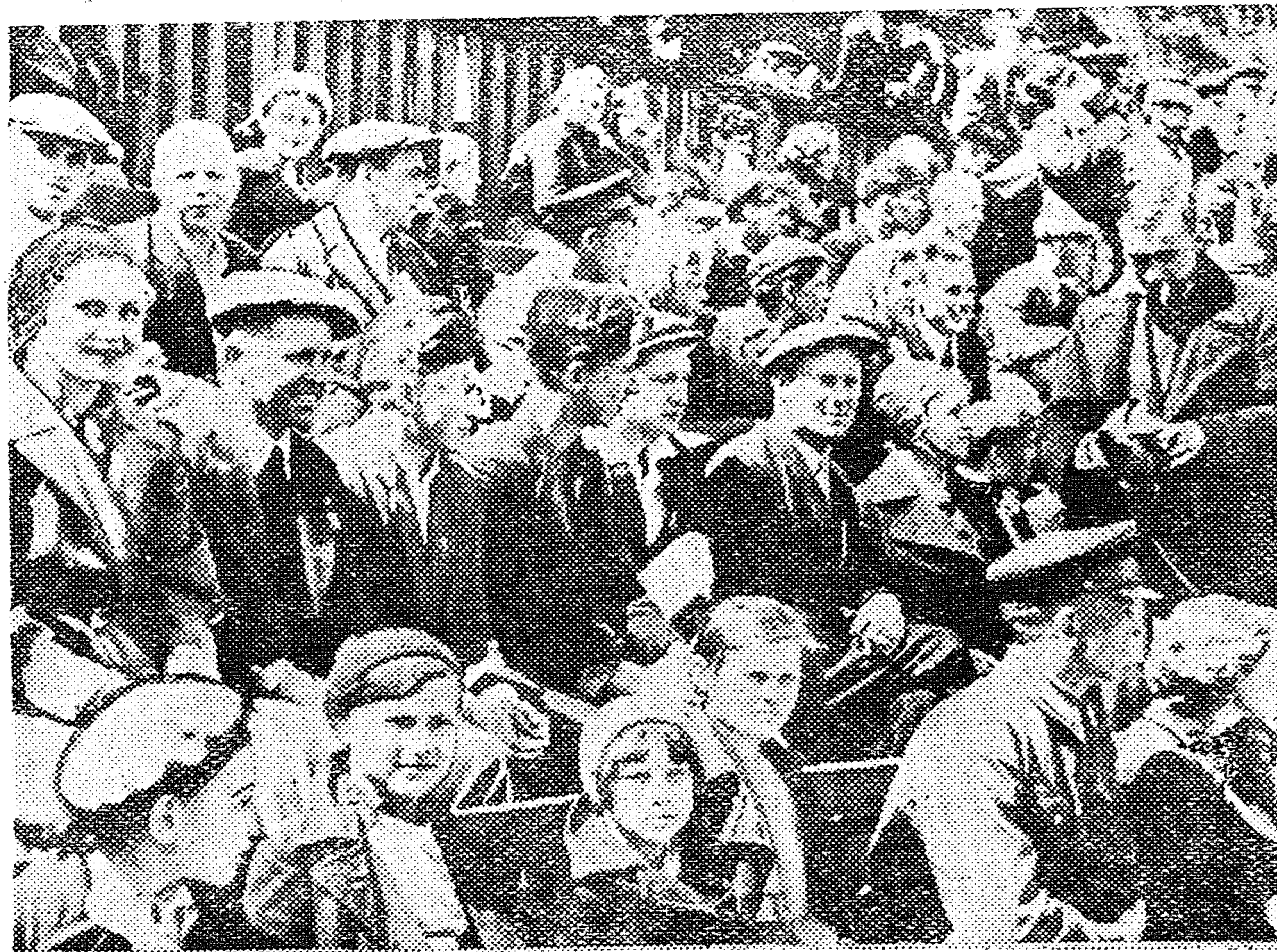
Менделеевцы на стадионе ЦДНА в день кросса им. «Комсомольской правды».