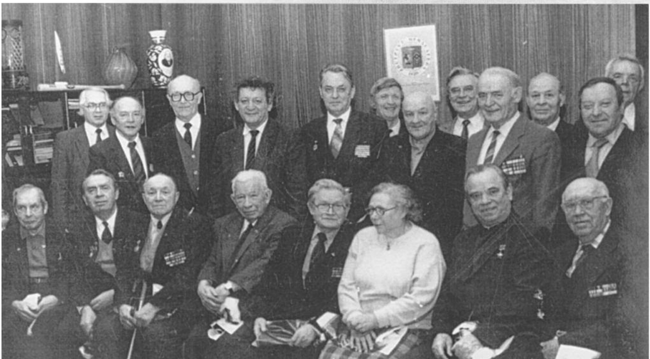
Декабрь 1991 года - участники встречи ветеранов в ректорате, посвященной 50-летию победы под Москвой