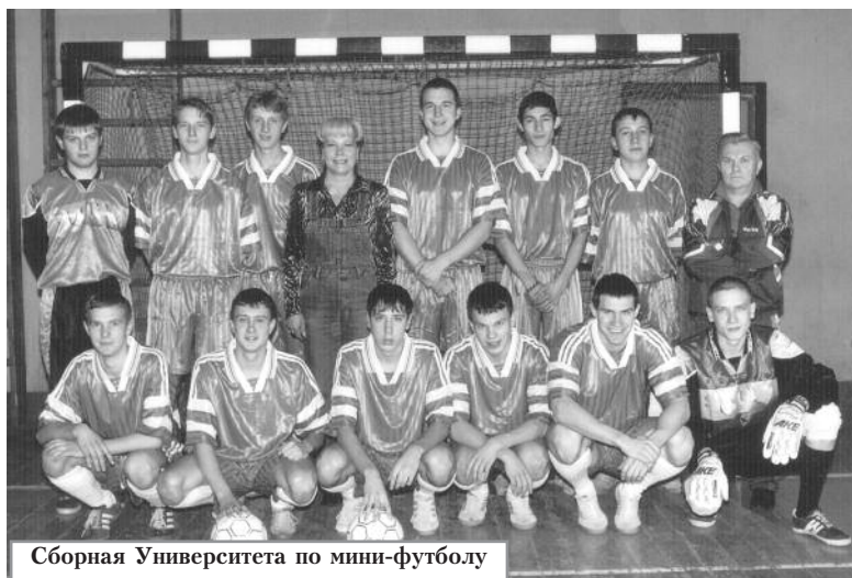
Сборная Университета по мини-футболу