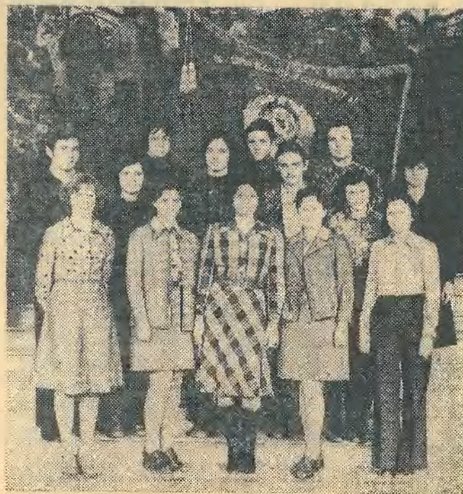
Студенты группы К-42 у Красного знамени института.